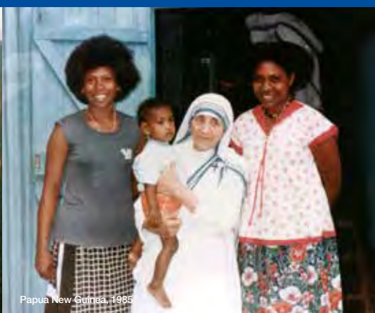
Papua New Guinea, 1985