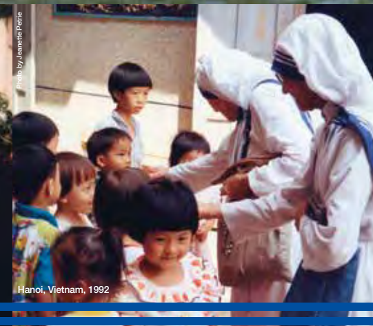
Hanoi, Vietnam, 1992