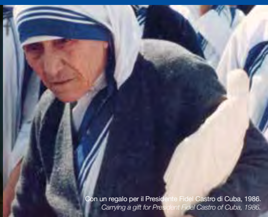
Con un regalo per il Presidente Fidel Castro di Cuba, 1986. Carrying a gift for President Fidel Castro of Cuba, 1986.