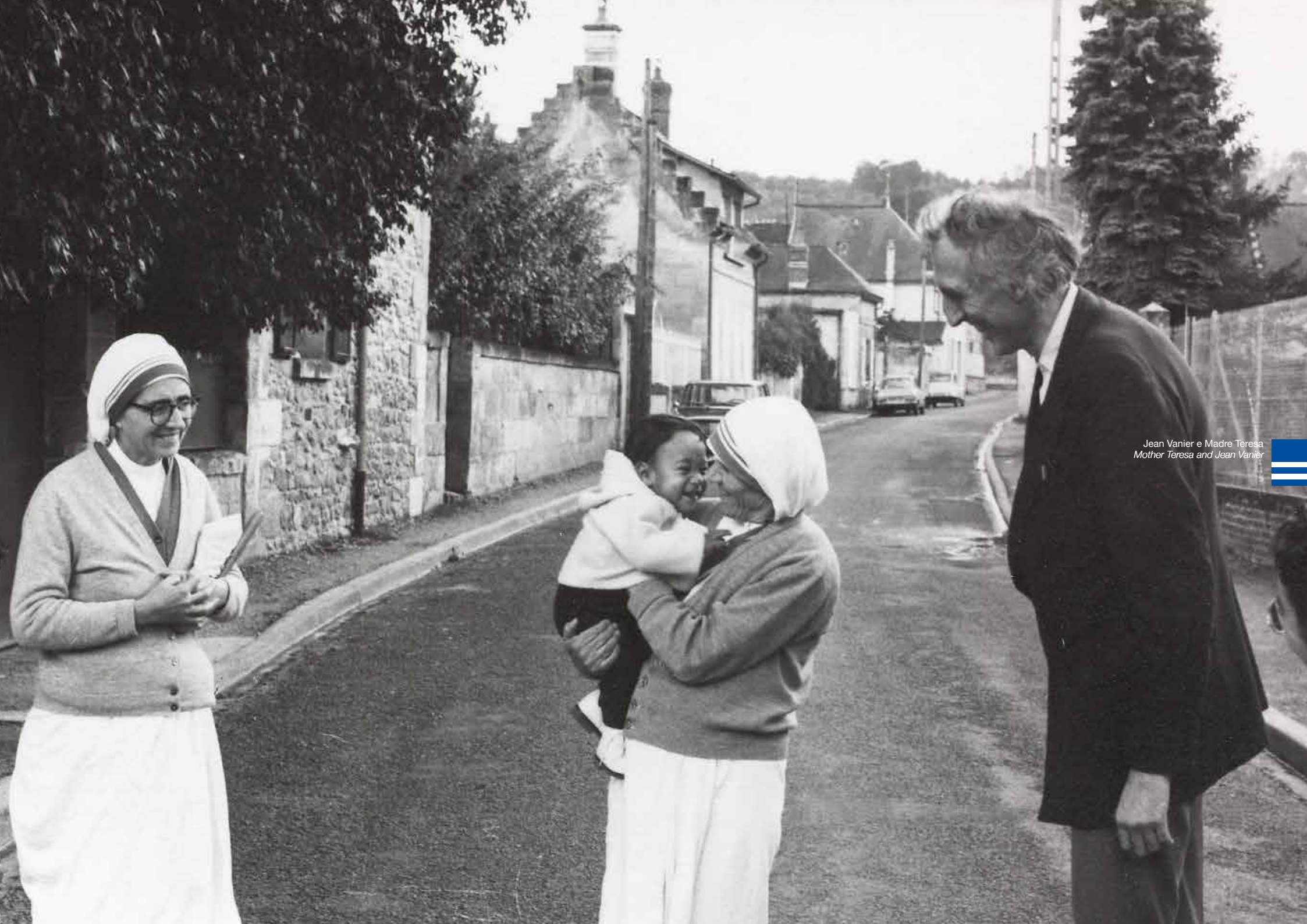
Jean Vanier e Madre Teresa Mother Teresa and Jean Vanier