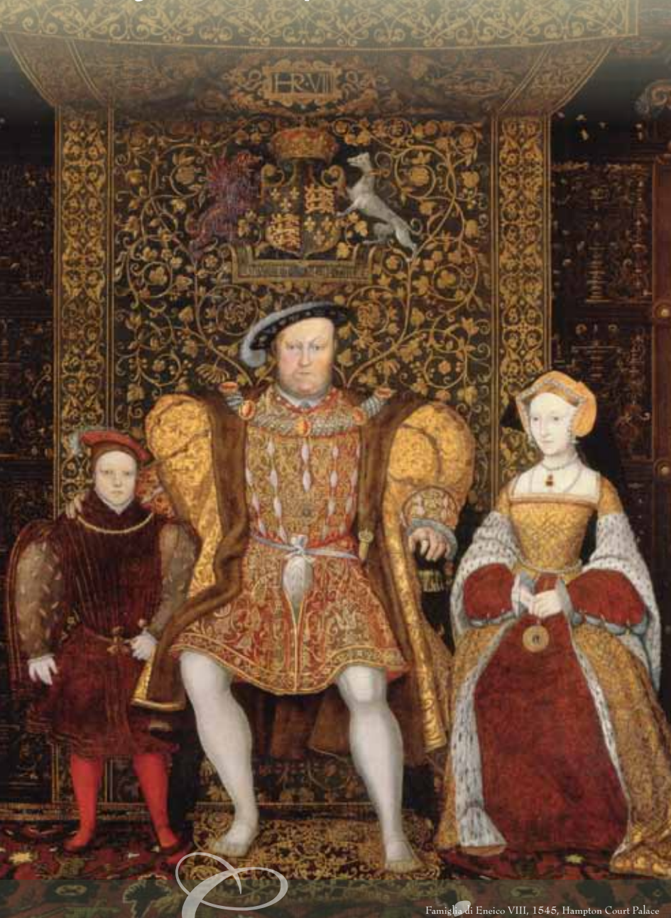
Famiglia di Enrico VIII, 1545, Hampton Court Palace

La separazione da Roma, decisa da Enrico VIII, segna la nascita della Chiesa anglicana. I cattolici subiscono violente persecuzioni. L'Inghilterra perde contatto con le proprie secolari radici cattoliche.