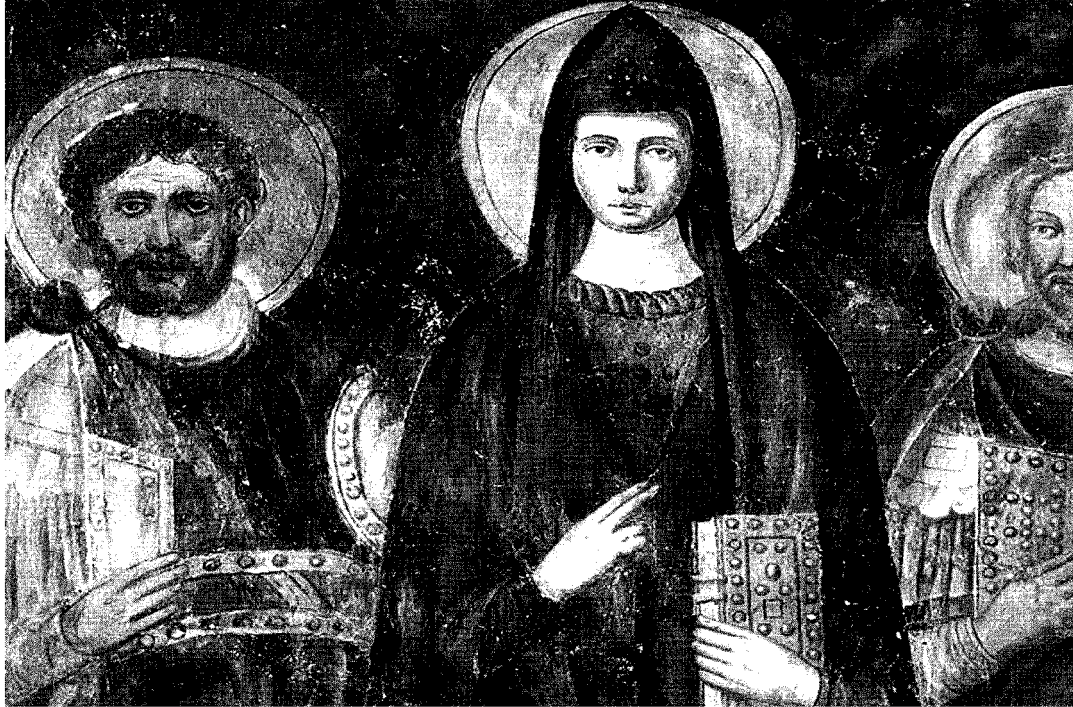
San Benedetto da Norcia tra i santi Cirillo e Metodio in un affresco che si presume del XII secolo (ritoccato nei secoli XVI e XIX) nell'abbazia di San Pietro ad Assisi