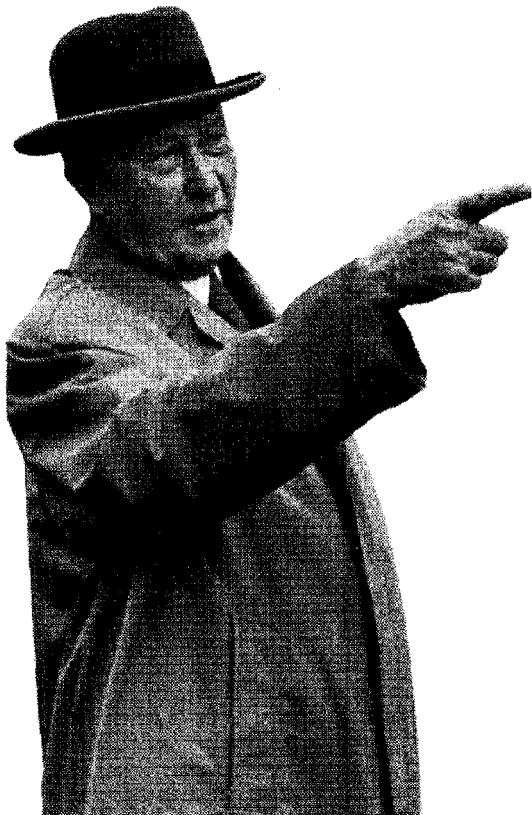
Konrad Adenauer uno dei padri dell'Europa contemporanea