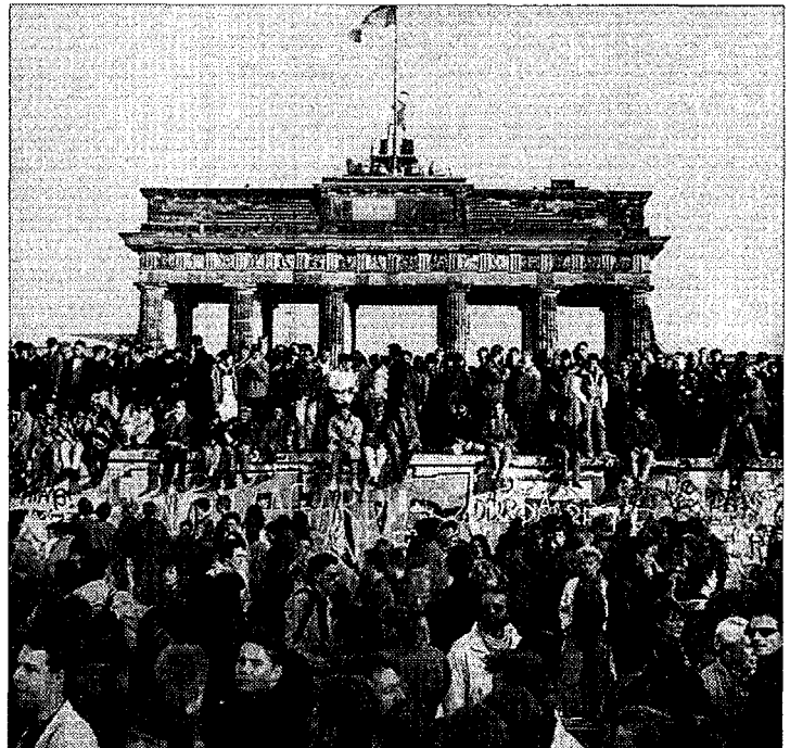
Il crollo del muro di Berlino del 1989