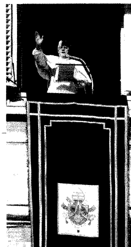
La folla ieri all'Angelus del Papa in piazza San Pietro

Ieri duecentomila persone sono scese in piazza San Pietro per assistere all'Angelus del Papa e rispondere così all'appello lanciato dal Cardinale Ruini dopo la mancata visita all'università La Sapienza di Roma: «Facciamo sentire la nostra solidarietà al Santo Padre». Moltissimi i politici di entrambi gli schieramenti. Fra gli altri, sono stati visti Rutelli, Franceschini, Alemanno, Gasparri, Cicchitto, Casini, Andreotti, Cossiga, Pisanu. Benedetto XVI ha ringraziato la folla.