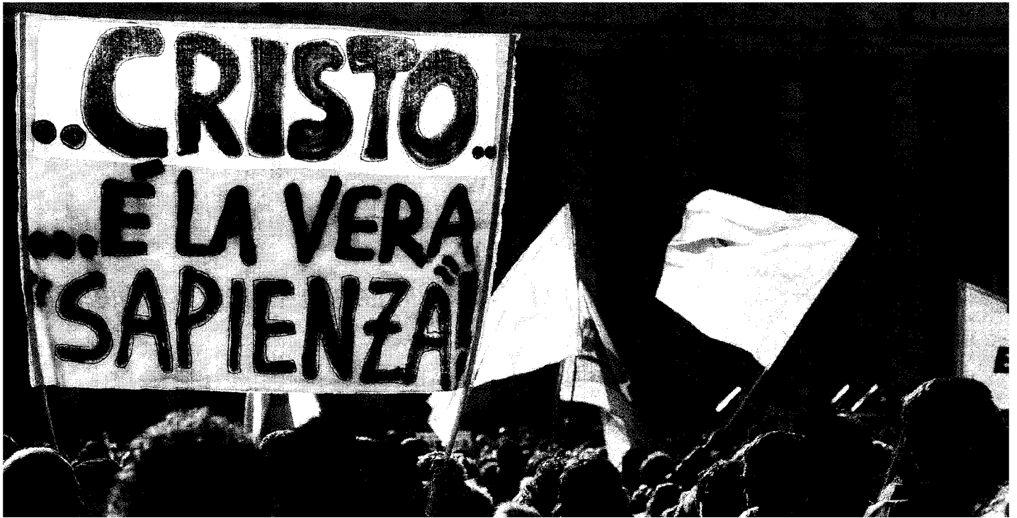
La folla ieri all'Angelus del Papa in piazza San Pietro