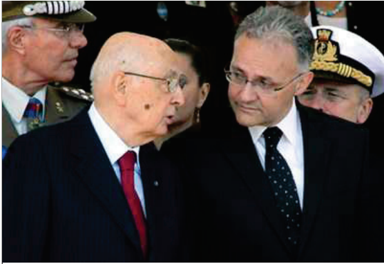
Giorgio Napolitano con Mario Mauro

In tutti i partiti ci sono fattori centrifughi e altri che muovono in senso contrario. Per dischiudere nuovi orizzonti in primo luogo ci vogliono leadership, in secondo luogo ci vogliono idee e proposte, e dal mio punto di vista il governo Letta è l'ultimo treno per ridare credibilità all'azione politica. Nel momento in cui questo governo saltasse, sia a destra che a sinistra – ma varrebbe paradossalmente anche per i nuovi soggetti come Scelta civica e M5S – ne deriverebbe innanzitutto un deficit di credibilità, perché quando la politica fallisce in circostanze così drammatiche, è il senso dell'efficacia e dell'efficienza della democrazia che viene meno.