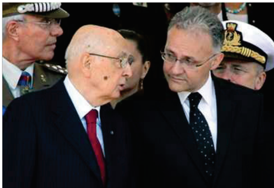
Giorgio Napolitano con Mario Mauro

Propongo un atto di realismo. Occorre ripristinare il senso dello stare insieme, che non è nelle corde naturali del centrodestra e del centrosinistra, è evidente, ma è qualcosa cui si è obbligati per le circostanze che il paese sta vivendo. Sarebbe la premessa sulla quale far germogliare una armonia, requisito indispensabile per parlare di giustizia, e arrivare ad un atto di clemenza di iniziativa delle camere, cioè un'amnistia. Questa – e lo dico a titolo personale – è l'unica alternativa reale a un confronto politico immaginato per troppo tempo senza esclusione di colpi. Da una parte e dall'altra.