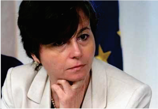
Il ministro dell'Istruzione Maria Chiara Carrozza

L'apertura della discussione sul contratto deve essere anche il momento per l'avvio di un percorso ed un ripensamento complessivo sul ruolo dell'insegnante che valorizzi l'impegno individuale, la capacità di lavorare in gruppo e l'aggiornamento.