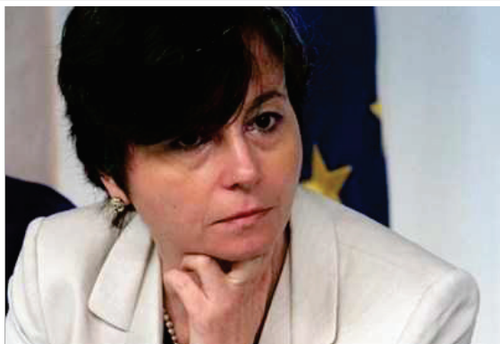
Il ministro dell'Istruzione Maria Chiara Carrozza

Le cifre assolute non dicono nulla. È noto che, confrontato con quello di altri paesi, il nostro sistema non è affatto quello più ricco. Ma – queste sono le cifre che contano – il numero di laureati è ancora troppo basso rispetto all'Europa; la classe docente si è depauperata ed è oggi la più vecchia del continente. La vera questione è l'efficienza. Un sistema pubblico dell'istruzione deve essere diffuso ma anche efficace. Il recente rapporto dell'Anvur ha indicato che esistono squilibri che vanno corretti ed eccellenze che vanno premiate. Lo faremo già con la distribuzione delle risorse per il 2013 (sul finanziamento ordinario e sulla programmazione triennale). Ma senza investire nel diritto allo studio e nel merito per gli atenei ogni intervento rischia di essere isolato: nessun reclutamento dei giovani, pochi studenti immatricolati. Inoltre c'è bisogno di un raccordo territoriale che aiuti a vincere gli squilibri oggi esistenti in Italia in un'ottica d'integrazione e ottimizzazione fra atenei ed enti di ricerca.