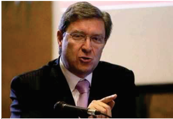
Enrico Giovannini

In testa alla lista metteremmo il tema delle cosiddette pensioni d'oro, dal momento che in poco più di 100 giorni di governo Letta ha dimostrato una grande sensibilità nei confronti dei temi "politicamente corretti" e graditi a un'opinione pubblica che desidera, spesso inutilmente, per sé di andare in quiescenza il prima possibile e con il trattamento il più elevato tra quelli consentiti e che, pertanto, è implacabile con chi quel miracolo lo ha realizzato. Poi verrebbe il turno degli esodati, una problematica che è andata troppo in auge - a torto o a ragione - sul piano mediatico da poter rimanere inevasa. Per quanto riguarda il lavoro, Giovannini - che riunirà lo staff il 3 settembre - ha dimostrato il proprio interesse, sempre parlando al Meeting, per il confronto affidato alle Parti sociali sulle regole del lavoro in vista dell'Expo e delle esigenze di ulteriore flessibilità che la gestione dell'evento richiederebbe. Poi navigano in Parlamento taluni progetti ambiziosi. Abbiamo già parlato del pensionamento flessibile, ma sono forti anche le tentazioni di misurarsi con il vespaio della rappresentanza sindacale. Giovannini, sornione, sta a guardare.