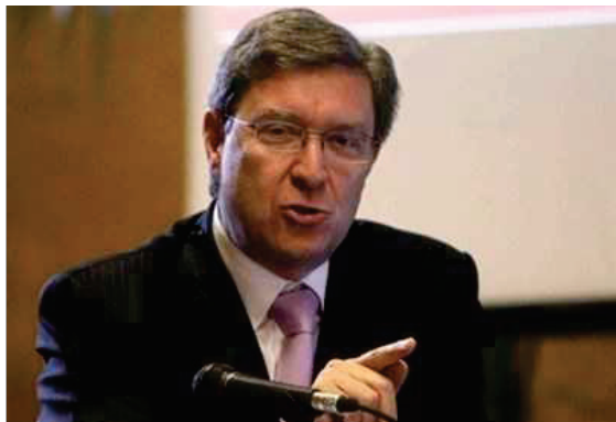
Enrico Giovannini

Enrico Giovannini è un ministro competente. Il suo principale merito, però, è la cautela. Ovvero il pessimismo dell'intelligenza. Si trova a far parte di un governo e di una maggioranza che non si fanno mancare nulla quando si parla di pensioni (la problematica rimandata a settembre). E deve, ogni giorno che l'Onnipotente manda sulla terra, fare i conti con un comunicato chilometrico di Cesare Damiano (il presidente della Commissione Lavoro della Camera) dove si ripete con incorreggibile monotonia il pacchetto delle rivendicazioni del Pd - imitate dal Pdl - incuranti dei conti pubblici.