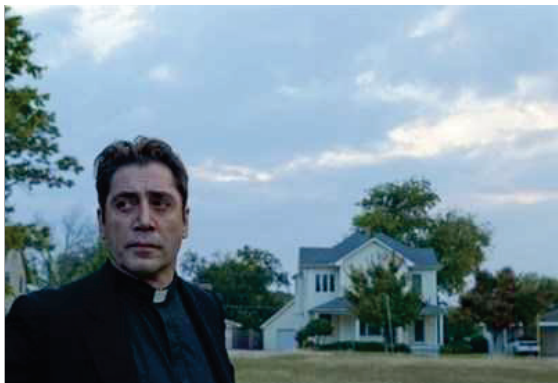
Una scena del film

Vero è che Terrence Malick, per la tensione morale facilmente rintracciabile nelle sue pellicole e per il carisma emanato dalla sua schiva e misteriosa figura, potrebbe essere a buon diritto considerata la figura emersoniana del cinema contemporaneo, anche solo considerando quella che è stata la seconda parte della sua carriera, inaugurata alla fine degli anni Novanta con La sottile linea rossa ( The Thin Red Line , 1998) dopo un silenzio produttivo che durava ormai dalla fine degli anni Settanta.