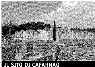
IL SITO DI CAFARNAO

È stato il luogo più scavato e più indagato dai francescani nell'ultimo secolo. Ed è probabilmente uno di quelli in cui l'archeologia cristiana ci ha raccontato di più. E proprio per permettere a tutti di assaporare questa ricchezza sarà dedicata a Cafarnao - la città sul lago di Galilea dove sono ambientati tanti episodi della vita di Gesù - una delle principali mostre dell'edizione 2011 del Meeting di Rimini , in programma dal 21 al 27 agosto. Curata da José Miguel Garcia, docente di esegesi neotestamentaria presso la Facoltà di Teologia San Dámaso di Madrid, ed edita con il