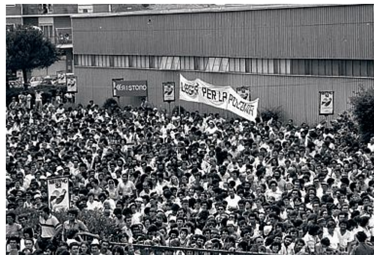
In alto l'ingresso di papa Wojtyla nei padiglioni del Meeting, sotto l'impressionante muro di folla che la vecchia fiera non era riuscita ad accogliere