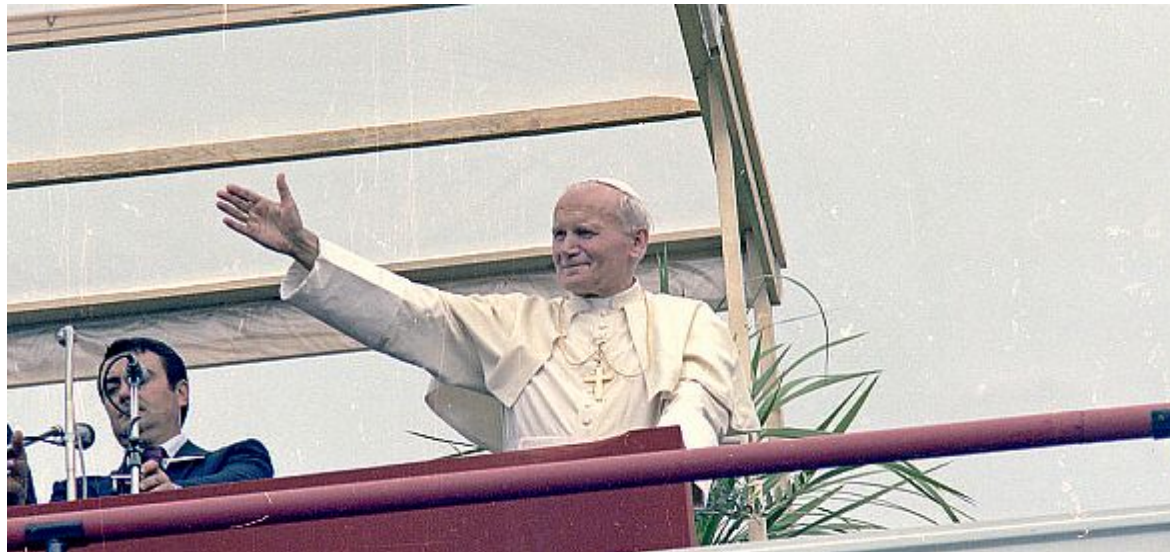
Il saluto del Santo Padre alla folla oceanica radunata sotto il palco di piazzale Boscovich. «Due o tre ferragosto in una volta»

AI TURISTI stranieri il Pontefice, nel corso dell'omelia, si è rivolto con alcune frasi in tedesco, francese, inglese, osservando singolarmente un ordine che rispecchia la consistenza delle correnti di traffico balneare. E ancora in tedesco, francese, inglese le battute finali: un gesto di omaggio a gente lonta-