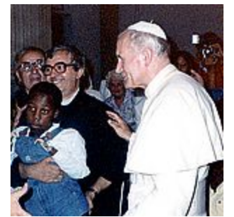
Il primo incontro fra don Oreste Benzi e Papa Wojtyla a Rimini

*Presidente del Meeting per l'Amicizia fra i Popoli