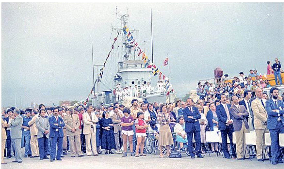
La folla dei riminesi in attesa della messa del Pontefice sulla palata del porto

Nel '34, fra il porto canale e la foce dell'Ausa, si arenò un pesce di proporzioni enormi. I primi a scorgere la massa indecifrabile, apparsa misteriosamente quando l'alba, per un attimo, imperla tutto il mare, furono un paio di pescatori di vongole. La notizia invase la marina correndo veloce col primo chiarore dei giorni settembrini, che hanno il cielo più alto e pare ve sia più spazio per tutto, per l'aria e per gli aquiloni. Quando arrivai sulla spiaggia la gente vi era già corsa a migliaia e migliaia e ancora ne veniva a ondate, verso un mare che non avevo mai visto così fermo. Il grande pesce, via via che cresceva la luce, si imbiancava; e il progressivo cangiare del colore ne trasformava anche la corpulenza, avvolgendola di una specie di un alone candido, qualcosa come l'aura che circonda le apparizioni. Tutti stavamo in silenzio, si udiva solo il ruscellare dell'acqua fra le con-