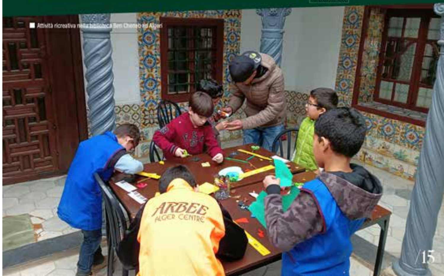
■ Attività ricreativa nella biblioteca Ben Cheneb ad Algeri