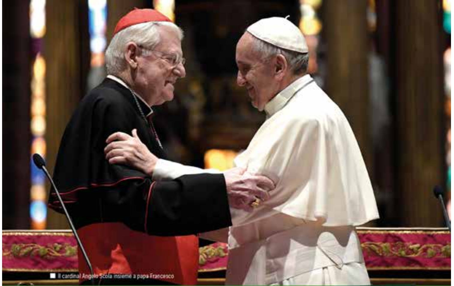
■ Il cardinal Angelo Scola insieme a papa Francesco