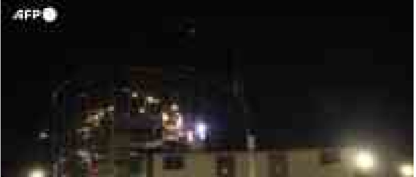
Prigozhin, fiori e candele davanti al Centro Wagner