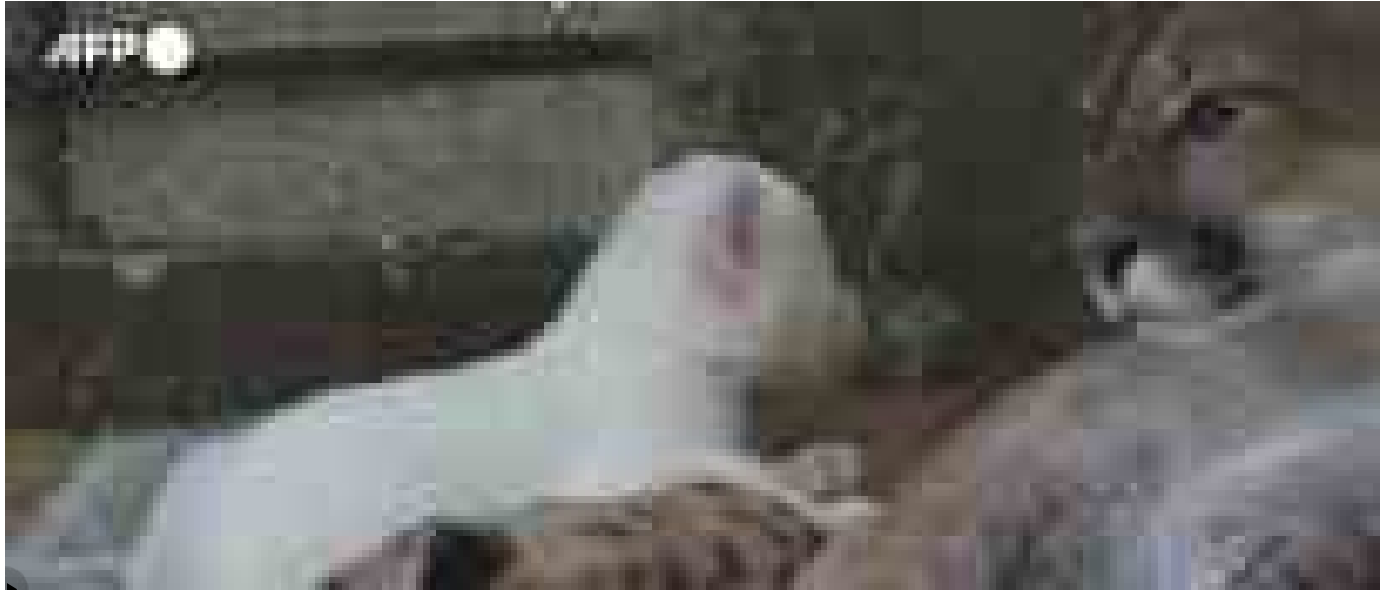
Raro cucciolo di puma albino nato in uno zoo in Nicaragua