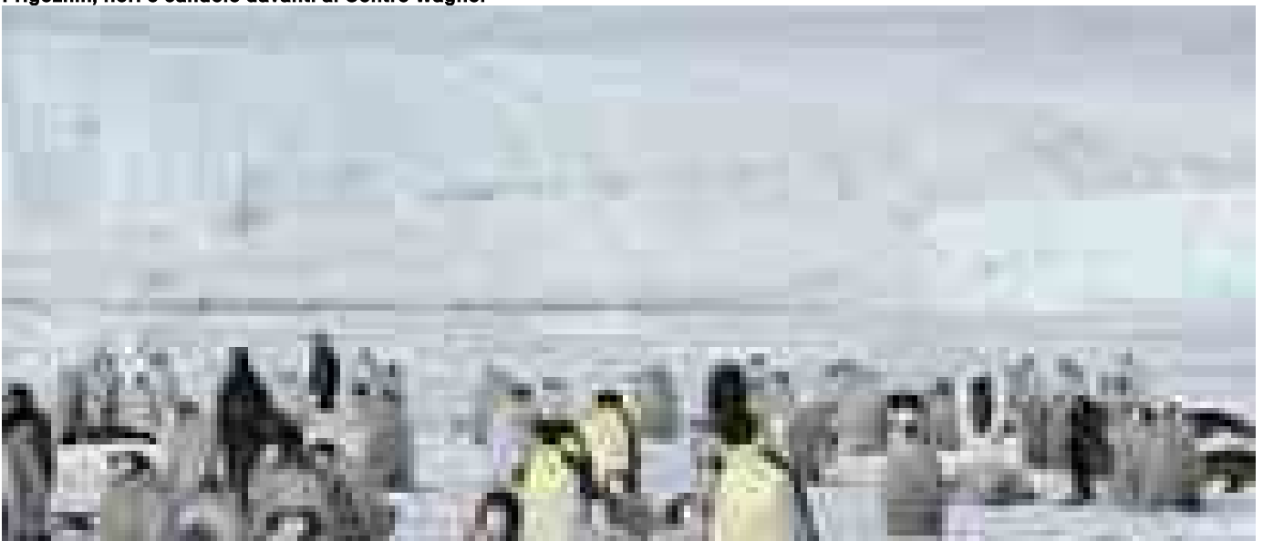
Antartide, è Sos per i pinguini: poco ghiaccio per riprodursi