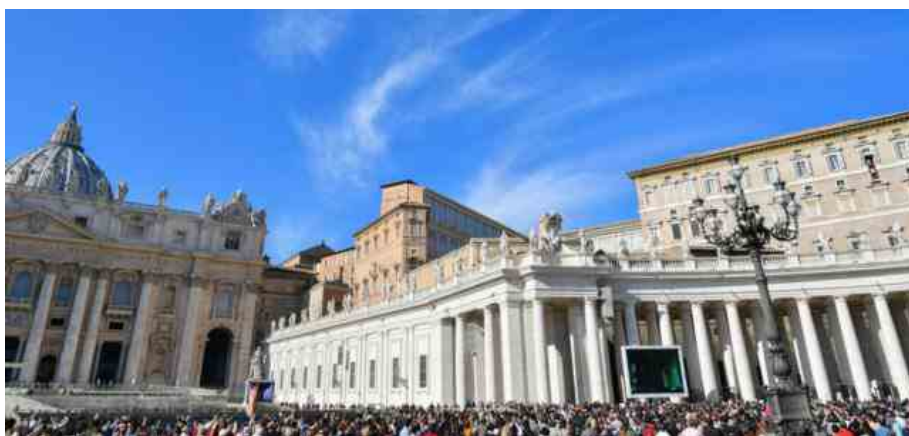
Vaticano, Piazza San Pietro

Il card. Dieudonné Nzapalainga, arcivescovo di Bangui (Repubblica Centrafricana) interviene oggi all'incontro inaugurale del Meeting