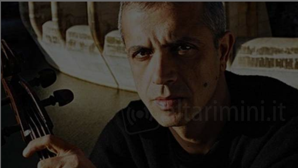
Giovanni Sollima, guest star del concerto dell'Orchestra Giovanile Sinopoli.

Archiviato il Ferragosto, l'estate riminese si prepara ad un'altra settimana ricca di appuntamenti. Riflettori sul Meeting per l'amicizia fra i popoli (20 al 25 agosto), crocevia di testimonianze ed esperienze di diversa provenienza culturale. Protagonista sarà ancora una volta la musica con l'arrivo al Teatro Galli dell'Orchestra Giovanile Sinopoli, il concerto di cinquanta giovanissimi musicisti per la Sezione della Sagra Musicale Malatestiana dedicata alla musica e ai giovani.