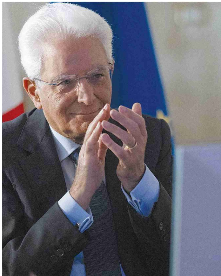
Collegato in videoconferenza Il presidente della Repubblica Sergio Mattarella durante il suo intervento al Meeting di Rimini Sotto, Papa Francesco