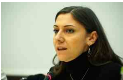
La viceministra dell'Istruzione Anna Ascani (PD)