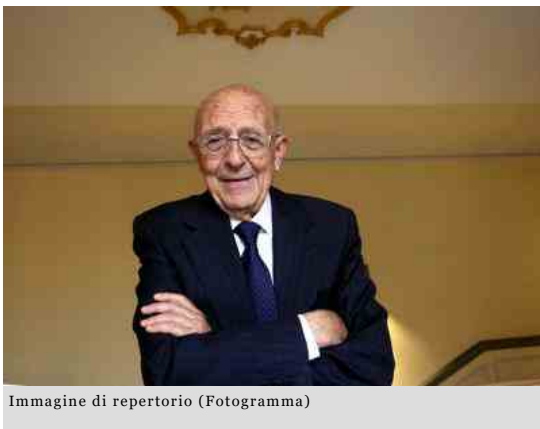
Immagine di repertorio (Fotogramma)